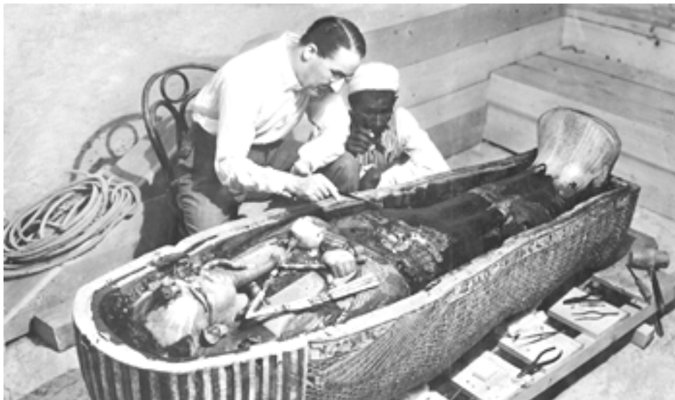
CARTER CON EL SARCÓFAGO DE TUTANKAMON. EL CRÁNEO APARECÍA ROTO

- Exactamente, Dr Matrix, es una apasionante historia que supera todo lo imaginable, que te relataré brevemente. Lord Carnarvon y Howard Carter eran dos famosos arqueólogos de imperio británico. Carnarvon financió una expedición de Carter a Egipto, en el Valle de los Reyes en Luxor. Carter detectó la tumba en 1922 y fue abierta en 1923 ante gran expectación mediática. Era la primera vez que se recuperaba un hermoso sarcófago que se encontraba además prácticamente intacto y una serie de tesoros fabulosos de riqueza inigualable. Pocos meses después del descubrimiento Lord Carnarvon moría repentinamente, dando lugar a la leyenda de la maldición de la momia, por la que todos sus profanadores habrían de morir. El canario de Carter fue engullido por una cobra, lo cual era un símbolo de la protección del faraón .La diosa Uadyet era la protectora del faraón. Hasta aquí la versión oficial.