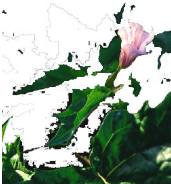
DATURA CONCOMBRE: LA PLANTA QUE FABRICA ZOMBIS