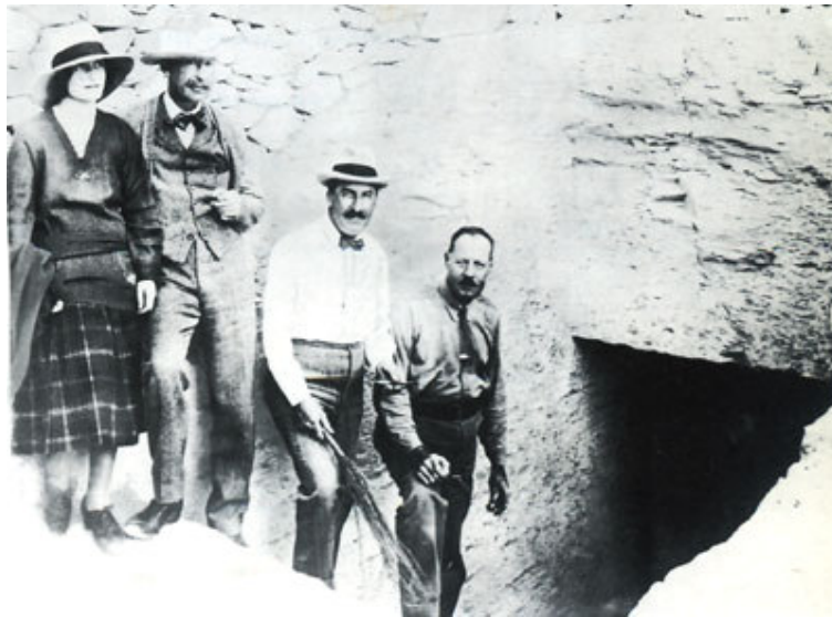
LORD CARNARVON Y HOWARD CARTER DESCUBRIENDO LA MOMIA DE TUTANKAMON

- Estos illuminati -prosiguió la niña índigo Nínive, mientras sus ojos verdes refulgían como esmeraldas, al tiempo que su nivea tez se ilumi-